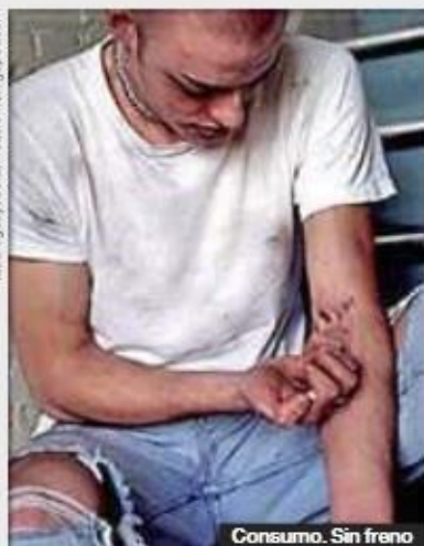
Consumo. Sin freno

gen mexicano, y es el Cártel de Sinaloa el principal proveedor.